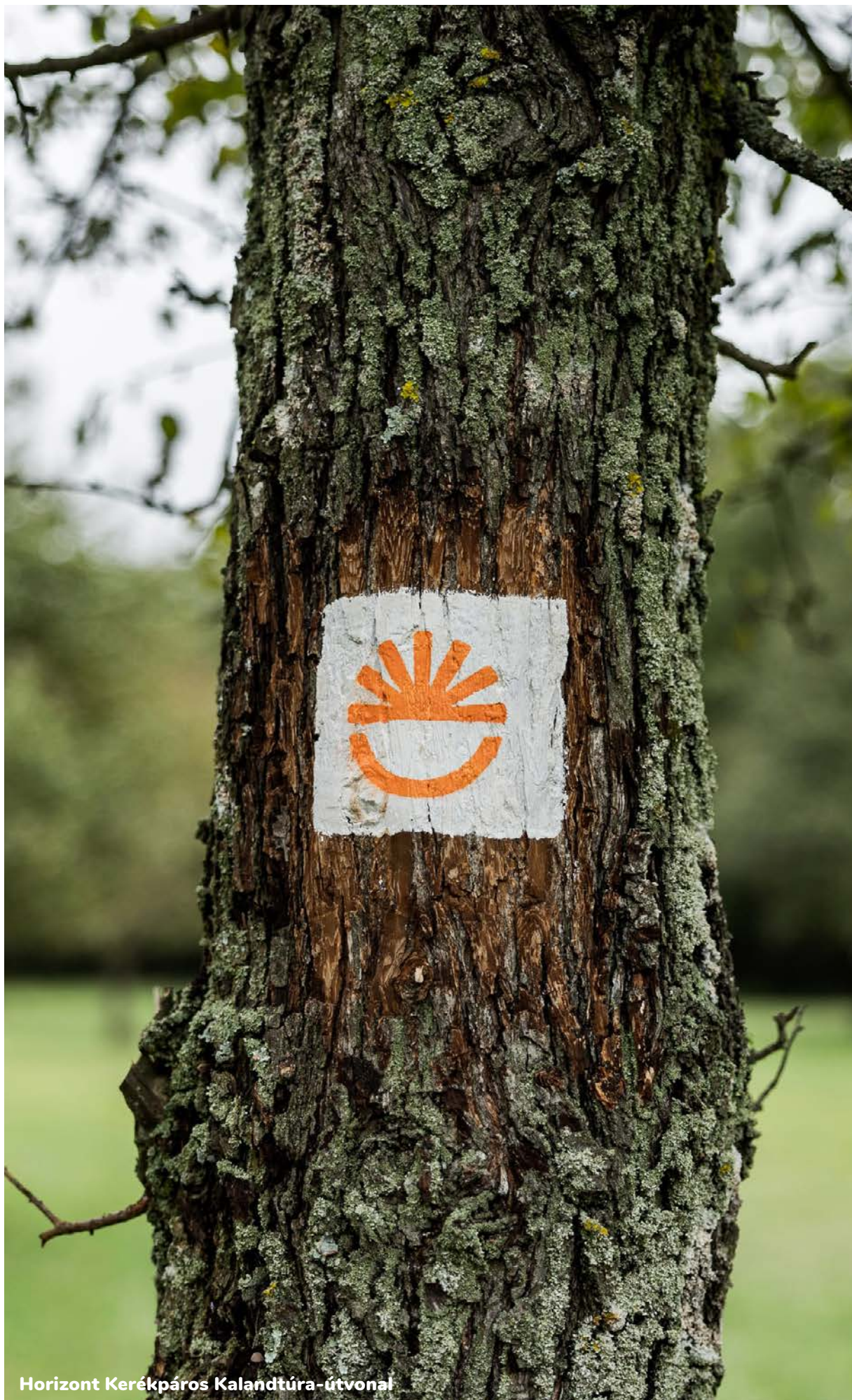
Horizont Kerékpáros Kalandtúra-útvonal